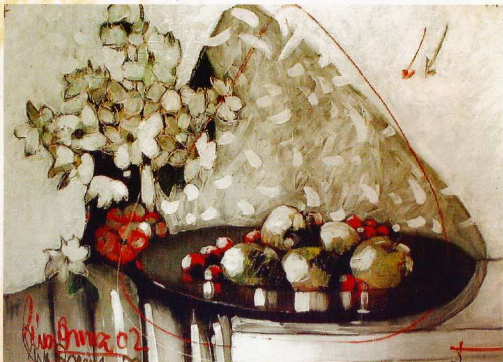
Blancos sobre blancos

Viamonte esq. San Martín - Galerías Pacífico Ciudad de Buenos Aires - Argentina