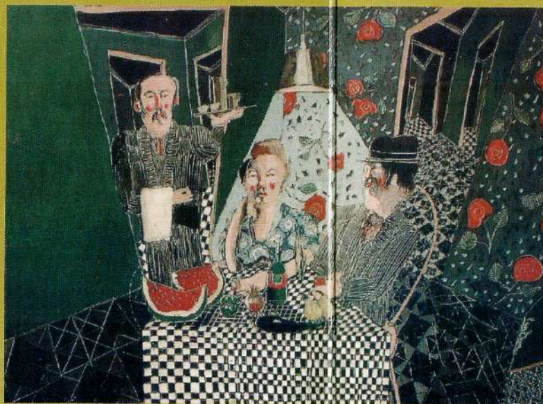
Sábado por la noche Oleo y resinas sobre madera - 0.44 x 0.62 m

Becerra exalta la condición dinámica de los objetos, porque necesita acentuar la presencia virtual de lo temporal, por eso todos parecen estar un poco corridos de foco, con lo que logra iluminaciones sutiles y transparentes. Con formas aparentemente neutras, desarrolla una repetición de imágenes muy al estilo de Bioy Casares en "La Invención de Morel", hay cierto mensaje sobre la naturaleza interior, la imagen proyectada y recibida, recibida y proyectada.