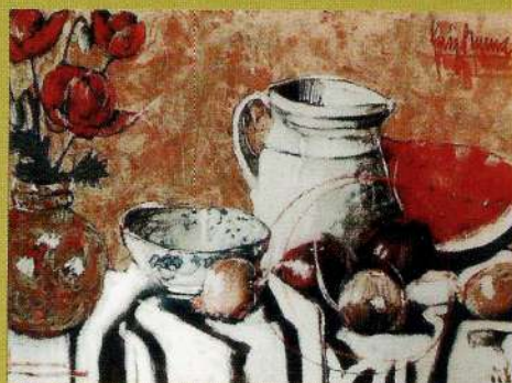
Sobre dorados Oleo y pastel óleo sobre tela - 0.80 x 1.20 m